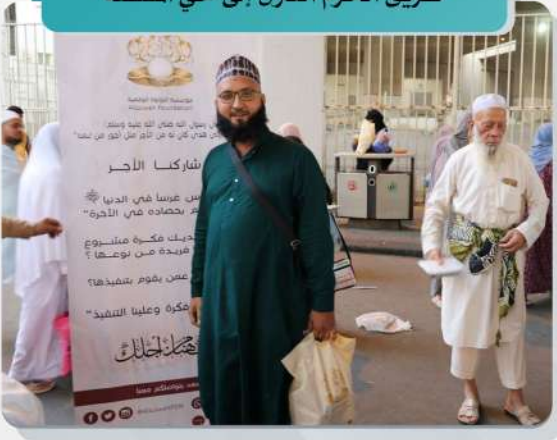
طريق الحرم النازل إلى حي المسفلة