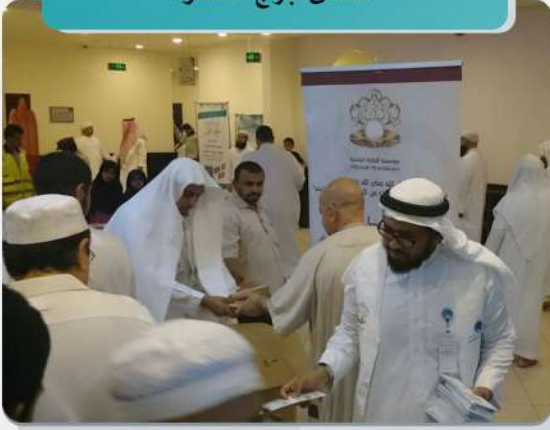
مصلى أبراج الصفوة