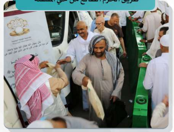
طريق الحرم الطالع من حي المسفلة