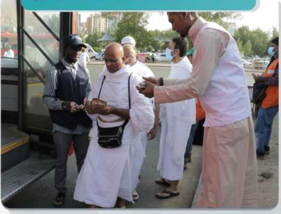
محطة حافلات نقل المعتمرين إلى الحرم بكدي