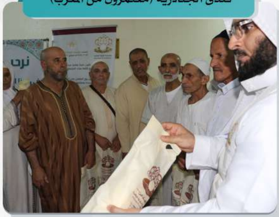
فندق الجنادرية (معتَمرون من المغرب)